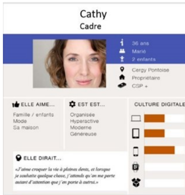
Exemple de buyer persona